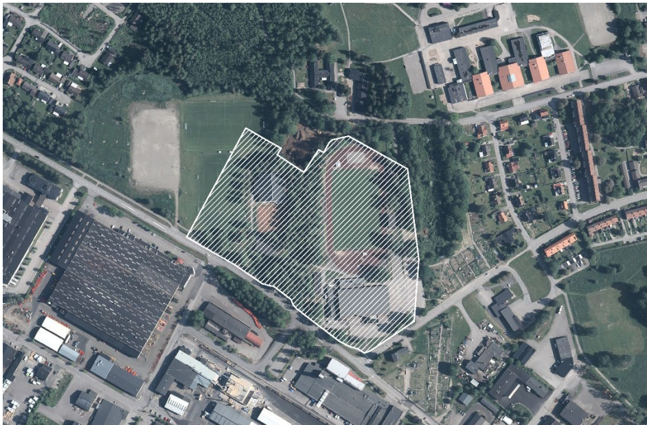
Planområdets lokalisering (skrafferat i vitt).

Planområdet är beläget i västra Alvesta.