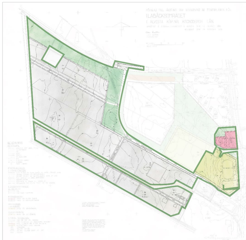
Bilden visar gällande delar av detaljplan A111.